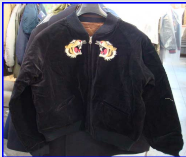
Dragon Velvet Jacket Made in USA